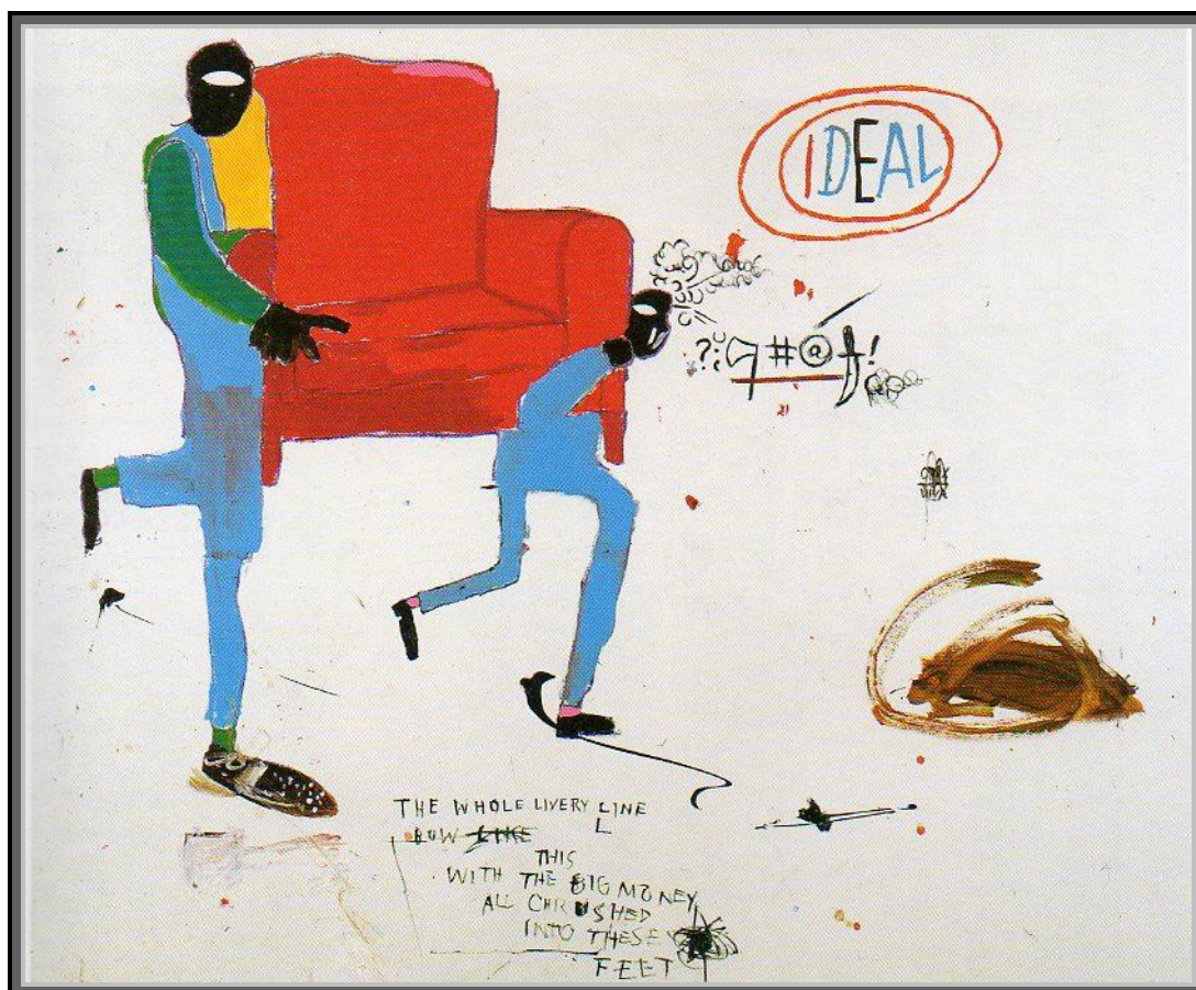
Jean Michel Basquiat, 1987

Site du GRP : www.groupe-regional-de-psychoanalyse.org